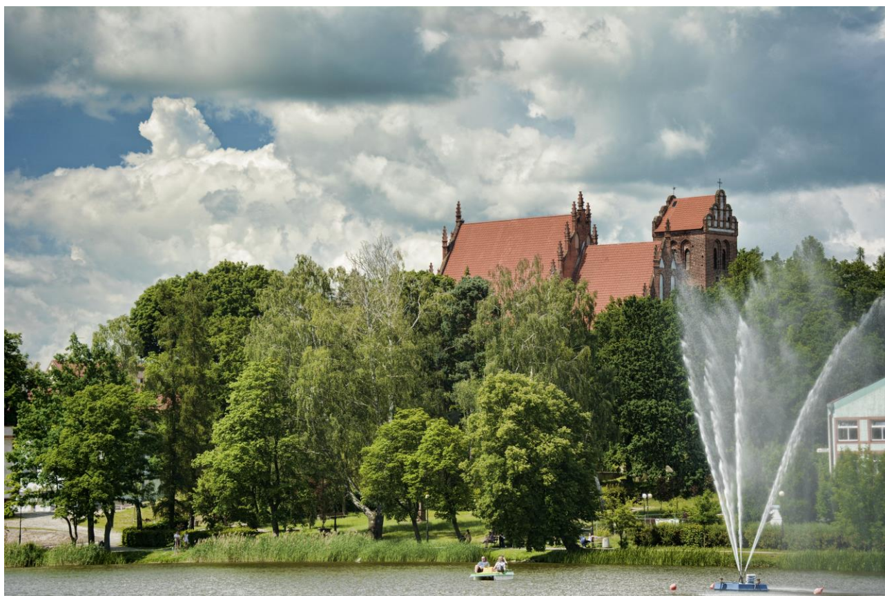
arch. Miasta Iława