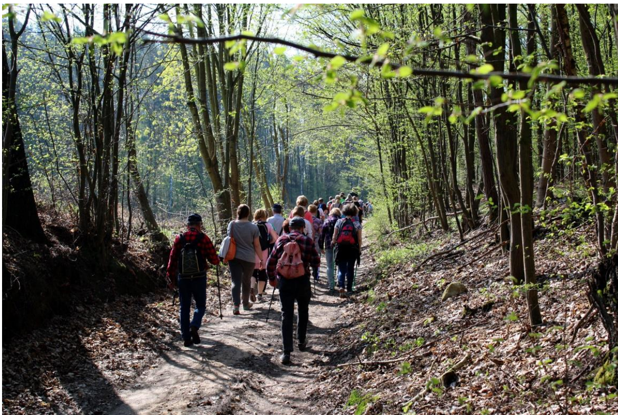
arch. Welski Park Krajobrazowy