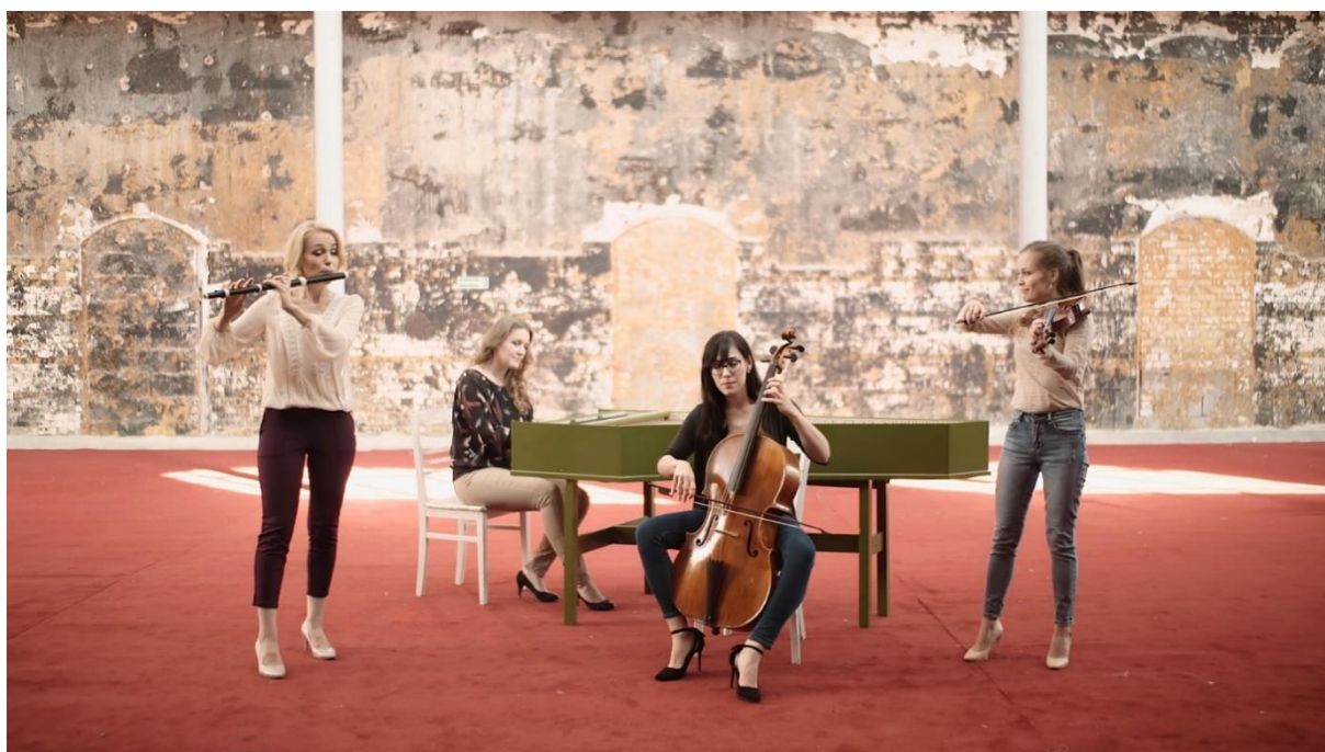
arch. Urząd Miasta w Giżycku

Festiwal odbędzie się już po raz 46. To największa tego rodzaju impreza muzyczna w Giżycku, popularyzująca muzykę organową i kameralną, a jednocześnie jedna z najstarszych w północno-wschodniej części Polski.