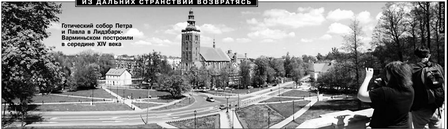
Готический собор Петра и Павла в Лидзбарк-Варминьском построили в середине XIV века