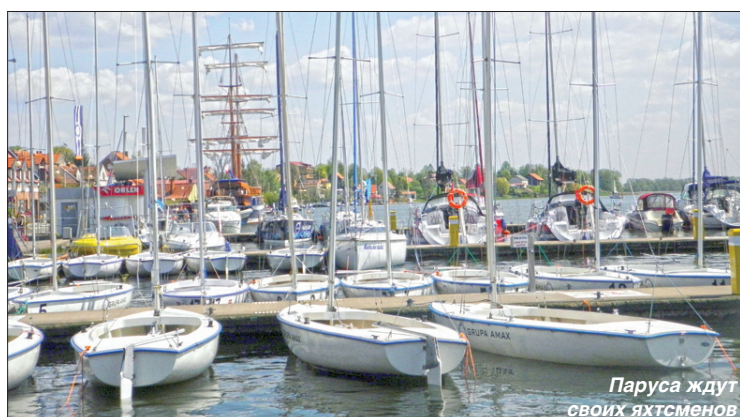
Паруса ждут своих яхтсменов

Современная инфраструктура и развитая система проката водного снаряжения, комфортабельные отели и апартаменты, вкусные блюда польской кухни – в Мазурах есть все для незабываемого путешествия. Недаром же Мазурские озера давно являются любимым ме-