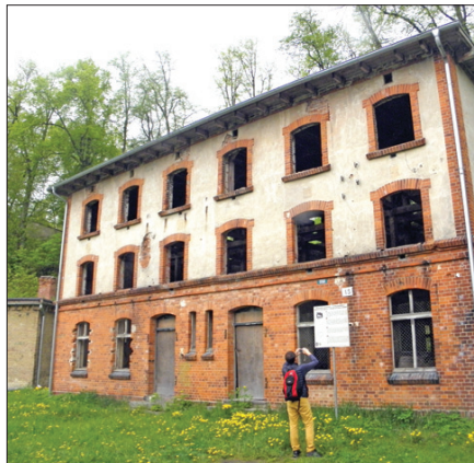
Голубятня на 700 птиц — так выглядел «пункт связи» с внешним миром в середине XIX века

ен — перекресток туристических маршрутов. Есть хостел, работает детская туристическая база отдыха. Планируется постройка четырехзвездочного отеля. На территории крепости проводят военные игры, театральные представления, концерты, съемки.