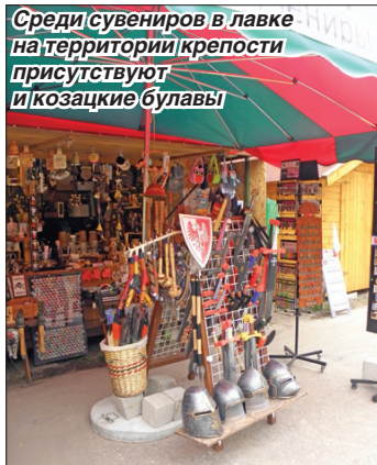
Среди сувениров в лавке на территории крепости присутствуют и козацкие булавы!

Крепость Бойен, построенная в середине XIX века как объект, блокирующий стратегический перешеек между озерами Неготин и Кисайно, имела большое стратегическое значение до начала эры авиации. «Налево — 30 километров воды, направо — 60 километров», — говорит гид. Одна из естественных