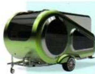
Kampeermiddelen van jonge designers