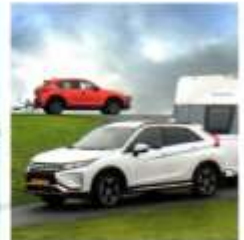
Mitsubishi Eclipse versus Mazda CX-5