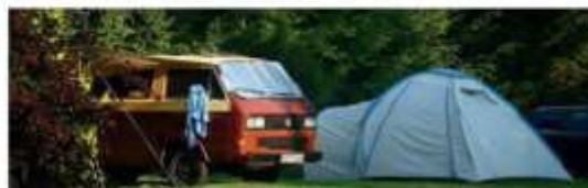
• Camping U Michala, Bialystok

adres Leśna 2, PL-11-730 Mikolajki t (0048) 87 421 60 18 | www.wagabunda-mikolajki.pl/camping gps 53.795526, 21.565075 open 1 mei t/m 30 september terrein deels door bomen omzoomd, licht glooiend. Kampeerplaatsen met verschillende soorten ondergrond, met en zonder schaduw. Ook speciale camperplaatsen beschikbaar