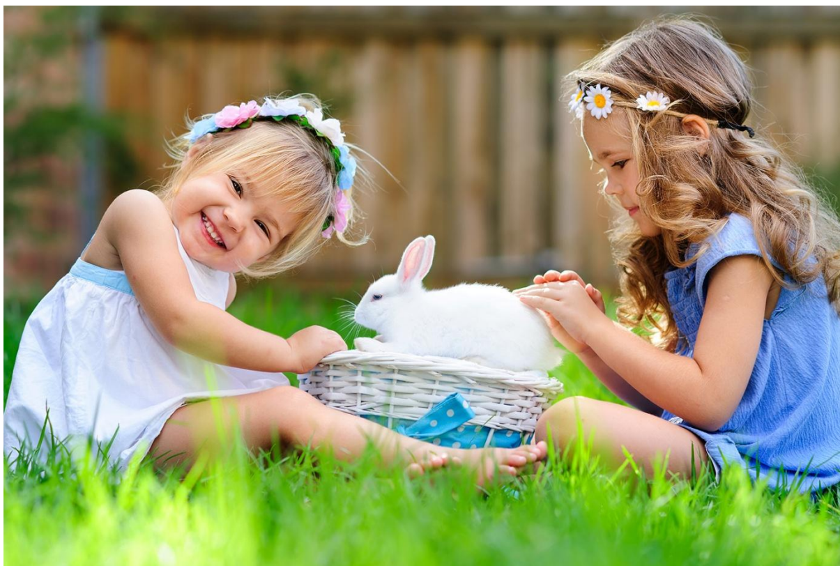
arch. Hotel Anders****

Hotel położony jest na Mazurach Zachodnich, nad brzegiem jeziora Szelałg Mały, na granicy rezerwatu Sosny Taborskiej. Hasło hotelu „Naturalnie na Mazurach” odnajduje swój wyraz w proekologicznej filozofii miejsca, cudownej przestrzeni i rozbudowanej bazie rekreacyjnej oraz regionalnej kuchni prowadzonej od 25 lat przez jednego, znakomitego szefa kuchni. Goście mają też dostęp do imponującego SPA z krytym basenem i saunami.