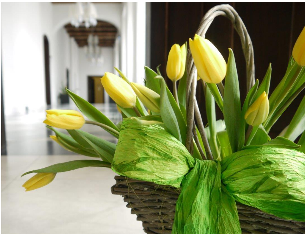
arch. Hotel Krasicki****

Bajkowo położony w widłach rzek Łyny i Symsarny hotel mieści się w historycznym przedzamczu rezydencji biskupów warmińskich. Dziś wytworne pokoje i apartamenty w gotyckiej i barokowej części hotelu nawiązują do pierwotnej stylistyki obiektu. Taras widokowy to znakomity punkt widokowy na cały Lidzbark Warmiński, zwany Perłą Warmii. W przyziemiu znajduje się SPA&Wellness, basen, jacuzzi, sala fitness i sauny. Inspirowana regionalnymi obyczajami kuchnia łączy tradycyjne i nowoczesne metody kulinarne.