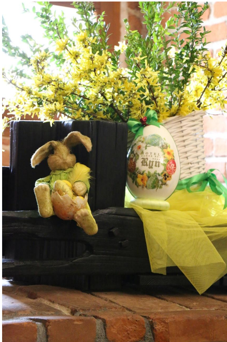
arch. Hotel Zamek Ryn****

Luksusowy hotel mieści się w zamku krzyżackim, który został pieczołowicie odrestaurowany, a najważniejsze imprezy odbywają się na zadaszonym dziedzińcu zamkowym. Jest to przykład harmonii średniowiecznej budowli i nowatorskich rozwiązań designerskich. Znana już nie tylko w kraju legendarna